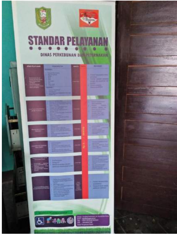
Standar Pelayanan dan Jenis Pelayanan