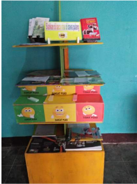
Leaflet dan Kotak Pengaduan